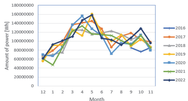
Fig. 1. Amount of power by month.

표 2는 2017년 1월부터 2021년 12월까지 연간 발전량과 증감률을 비교하여 나타낸 결과이다. 2017년 발전량은 1,311.48 MWh이었으며 2018년 발전량은 1,226.03 MWh이었다. 2018년은 2017년 대비 93.49%를 발전하였다. 2021년에는 1,184.28 MWh를 발전하였고, 2017년 대비 90.30%를 발전하여 매년 1.94%씩 발전량이 감소하였다. 발전량이 감소하는 원인으로서는 날씨 변화, 오염, 유지 보수 및 청소 부족, 태양광 모듈의 시간 경과에 의한 노후화 등이 원인으로 생각된다 [9].